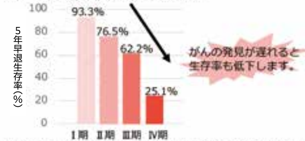
図2 子宮がん(頸部)の病期別5年相対生存率